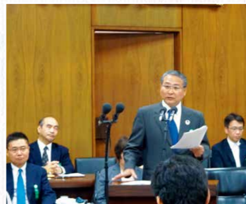
衆議院法務委員会での発言するくれまつさん

くれまつさんの活動は新聞やテレビで紹介され、NHKの「NEXT 未来のために」では全国放送されました。